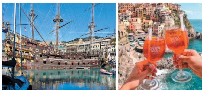
In alto la folla che ogni giorno invade la Piazzetta di Portofino sopra il galeone di Genova e l'immagine virale dello spritz a Manarola